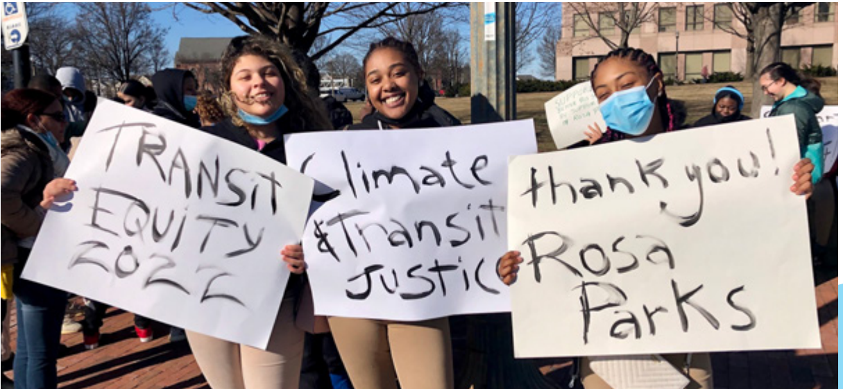
De izquierda a derecha: Transit Equity 2022; Clima y Justicia de Tránsito; ¡Gracias! rosa parques

¡Seamos claros! El Plan Maestro de Tránsito es simplemente una visión y un conjunto de recomendaciones. Todavía requiere financiación y tiempo para implementarlo. Por lo tanto, todos los interesados deben hacer oír sus voces sobre lo que debe priorizarse primero para su vecindario y su comunidad.